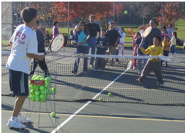
十一月七日的网球嘉年华，大人孩子各个玩得都很尽兴。。