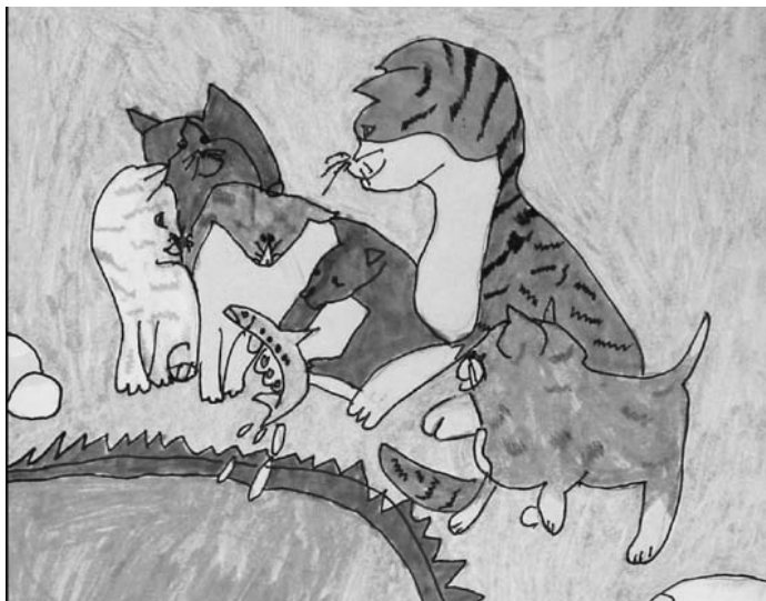
绘画: Annie Xu