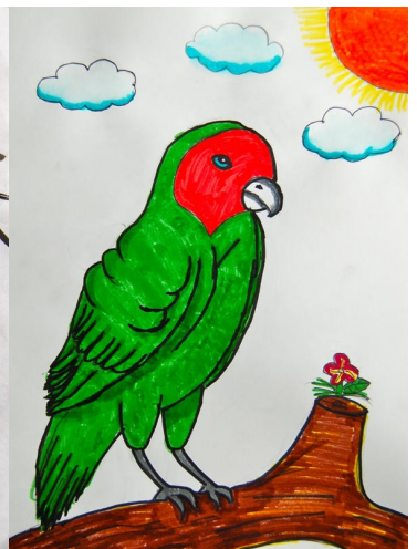
水彩笔画一鹦鹉 Lauren Yang 10岁