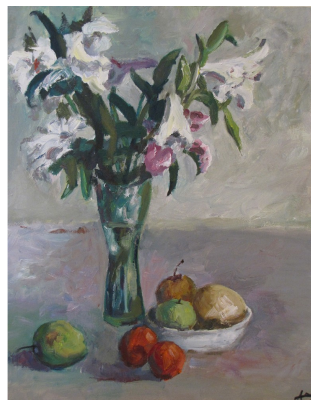
右图 绘画作品：沈恩妮（14岁） 指导老师：王宗周

什么长长在中国？什么长长在美国？ 长城长长在中国，密西西比河长长在美国。 什么高高在亚洲？什么低低在美国？ 喜马拉雅山高高在亚洲？死谷低低在美国。