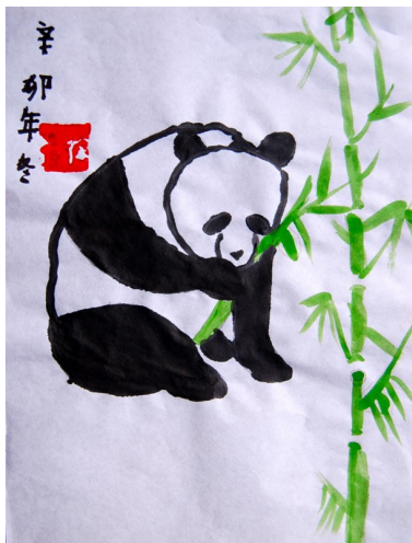
国画一熊猫 徐浩雯 9岁