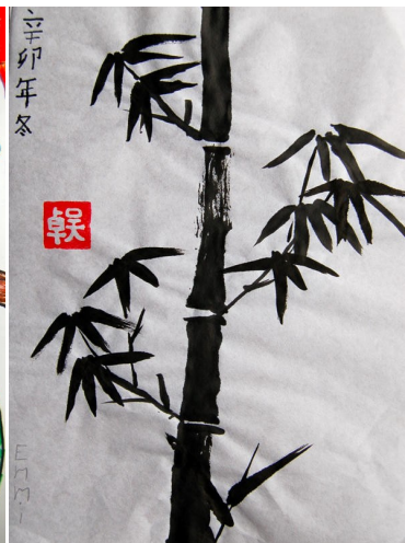
国画一竹子 吴卓 6岁