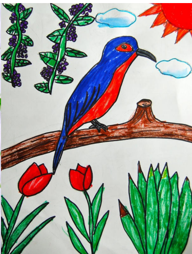
水彩笔画一春之声 徐浩雪 7岁