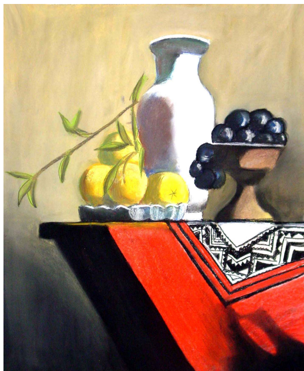
绘画: Claire Song