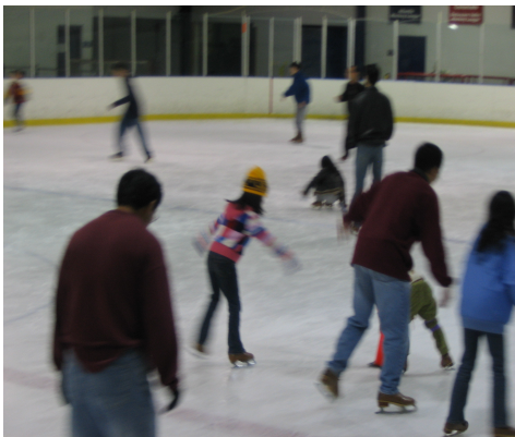
△ 上图摄于11月4日学校溜冰活动。

我有时候也会摔跤。有一次我撞到一个大姐姐的身上,我摔得好痛。经过几次摔打,我终于学会了溜冰。