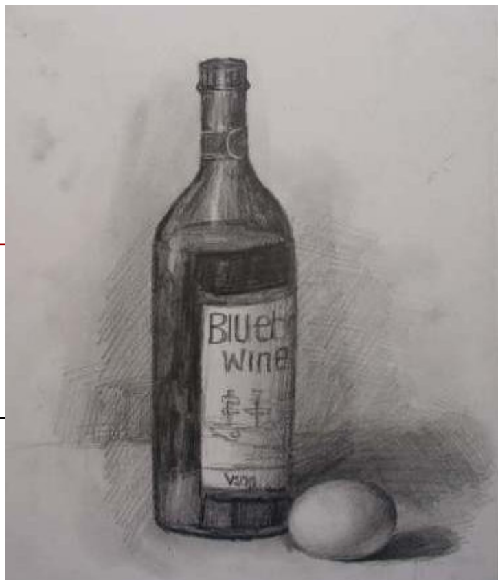
绘画：屠露菲 指导老师：王宗周