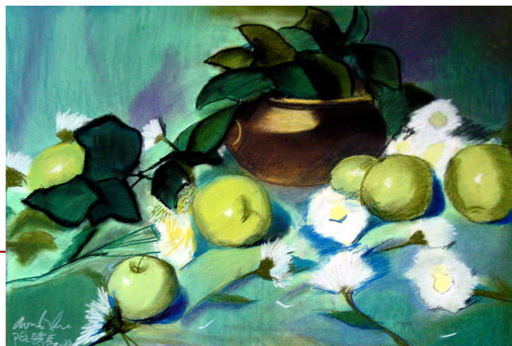
绘画: Christina Chen