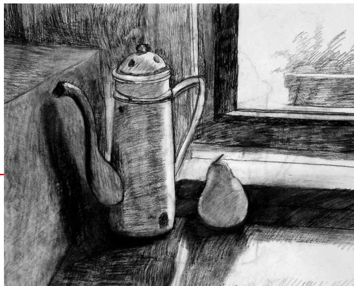
绘画: Annie Xu 指导老师: 李国富