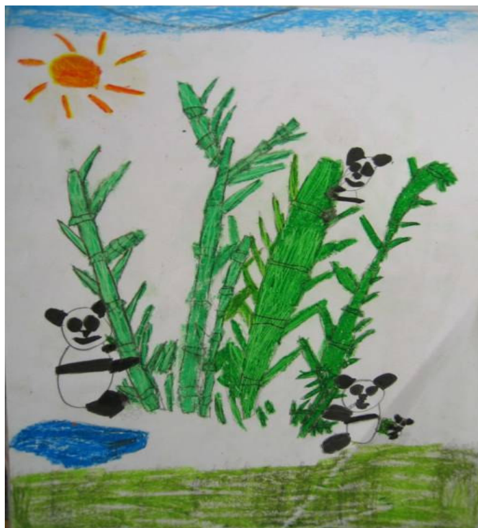
绘画: Shannon 指导老师: 马月娟