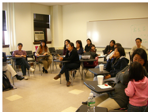
家长茶话会