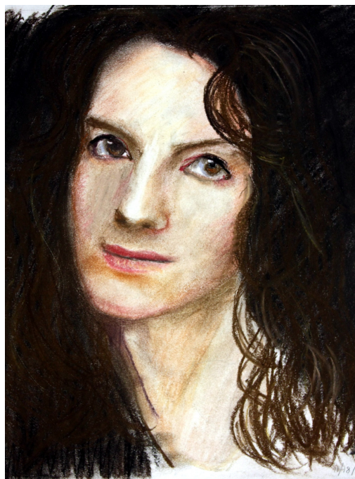
学生油画棒人像素描, 指导教师陆文浩