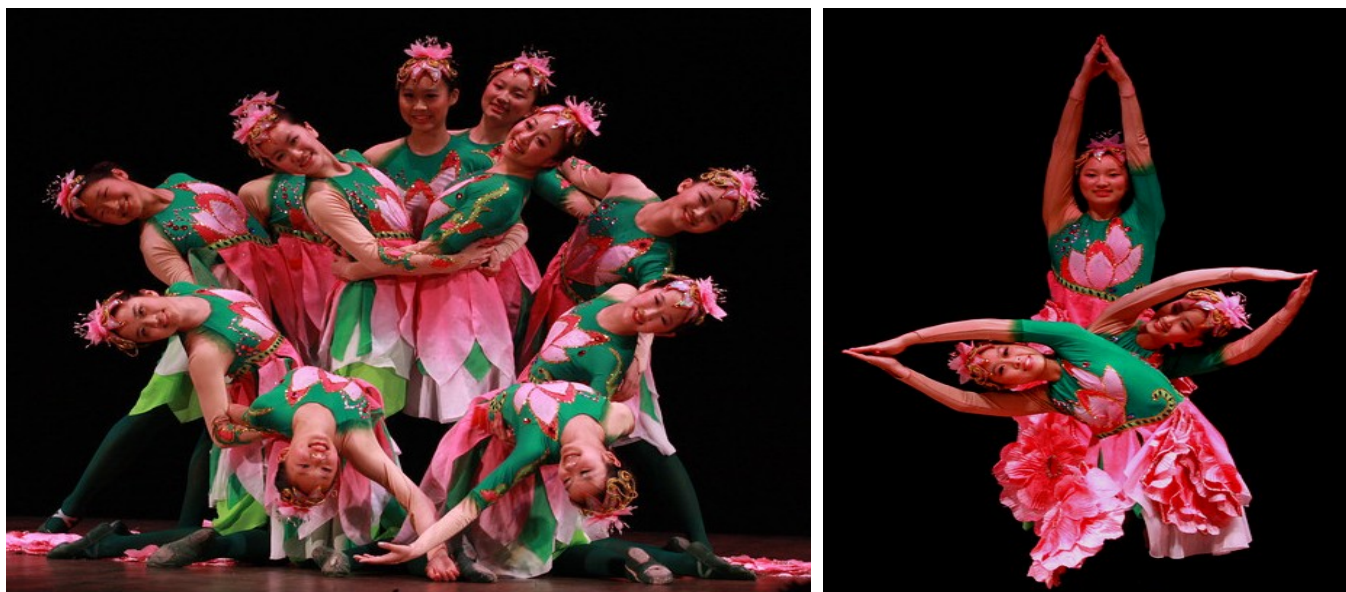
上图：《姹紫嫣红》演出照

长城中文学校舞蹈大班不愧“小木兰”的称号，她们再一次发挥了小木兰自强不息的精神，把最炫的中国民族舞蹈呈现给更多的美国观众。她们不但是花的使者，也是中国文化的传播者。祝小木兰舞蹈班像姹紫嫣红的花儿一样，茁壮成长，开的更加多姿多彩。