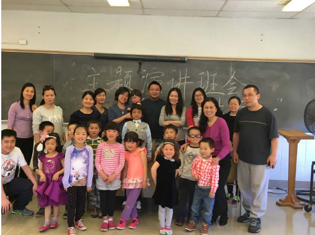
KD 学前班学生及家长合影