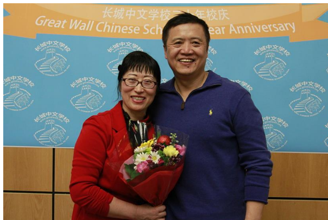
依慧理事长和先生