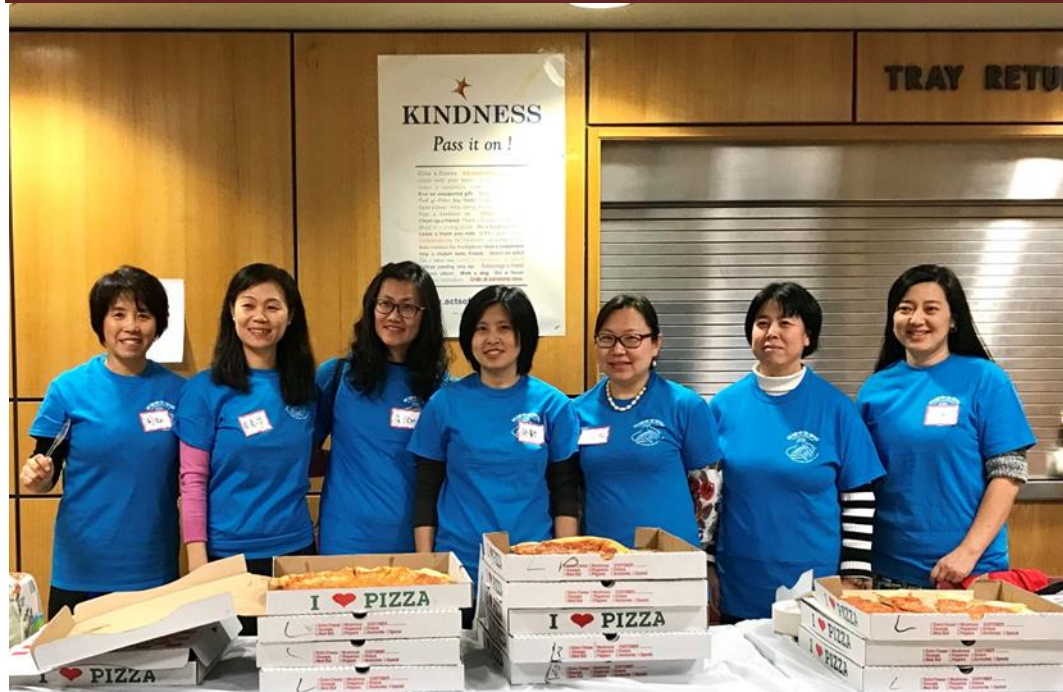
长城中文学校的义工们（四）