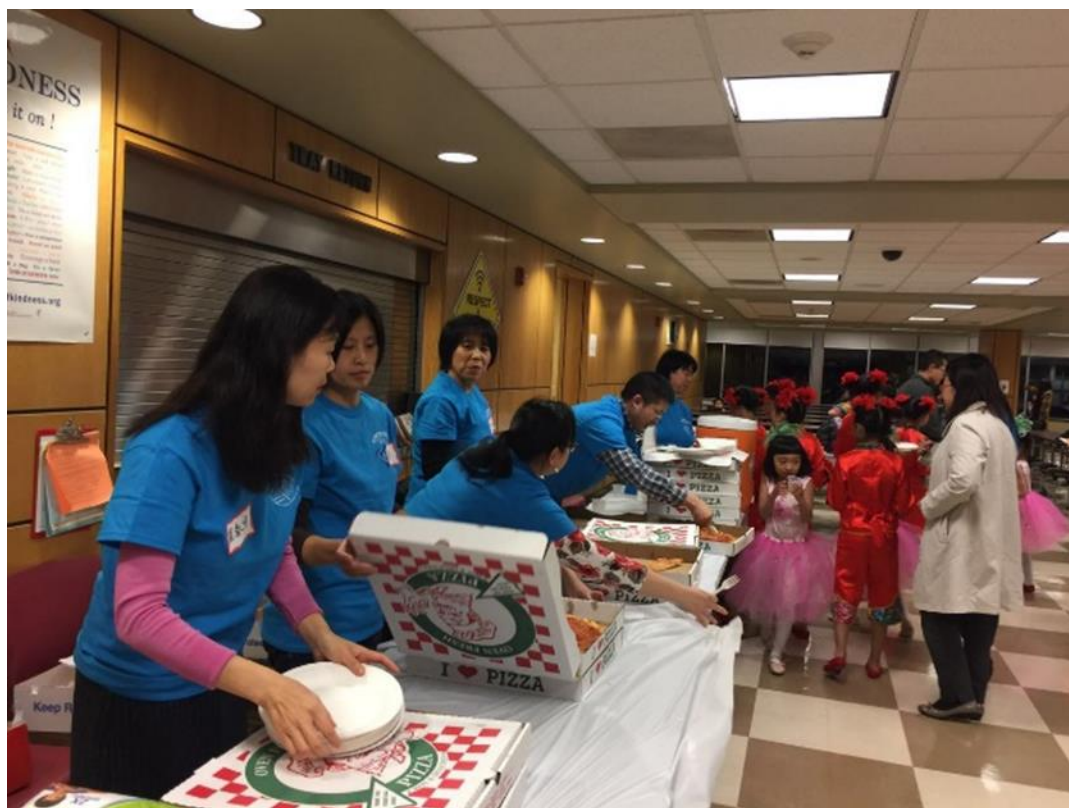
长城中文学校的义工们（三）