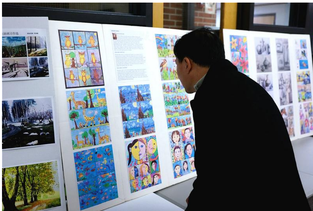
长城中文二十周年学生画展