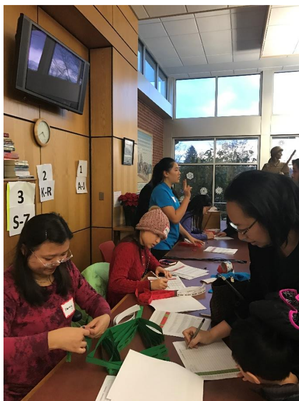
参加校庆的来宾在登记注册