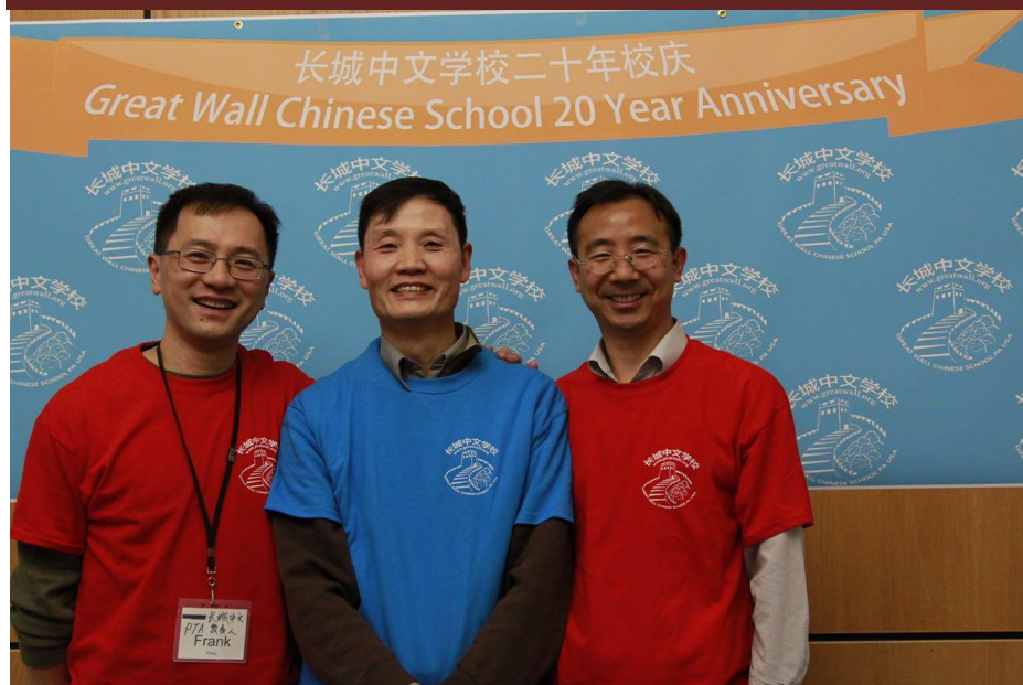
长城中文学校的义工们（二）