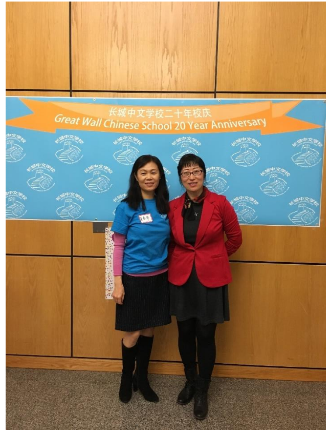
理事长依慧和学生家长

《我和长城》长城中文学校二十年校庆征文在短短的不到一个月的时间内共有 35 名同学参加。许多三到六年级的学生，用他们在学校学到的汉语写作技能，表达了对学校、老师和中文学习的热爱和感激。在激情洋溢的字里行间，同学们赞扬了长城中文学校不但提供了优良的学习中文的机会，尤其可以参加 HSK / YCT 汉语标准考试，作文比赛，演讲比赛，汉字比赛，中华文化知识比赛等等，还提供了很好的学习画画，民族跳舞，数学，Lego 编程，SAT，English writing，AP 中文，计算机编程，跆拳道等等，每年一次的春节晚会和游园更是让人流连忘返。