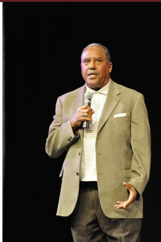
学生家长 Judge James Deleon 讲话