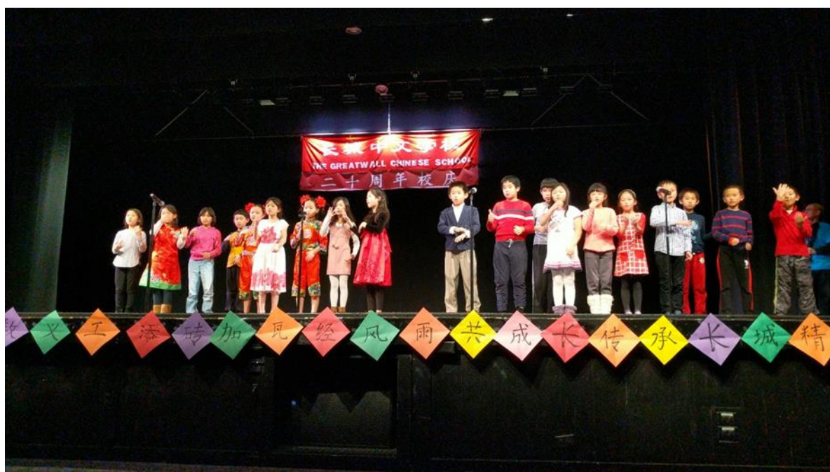
四年级小朋友表演：感谢！