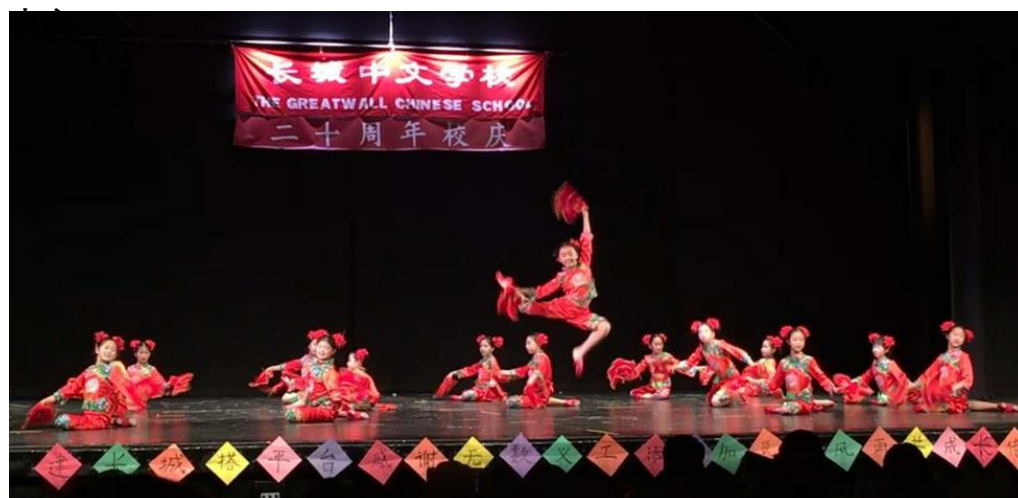
舞蹈班小朋友的演出：喜庆