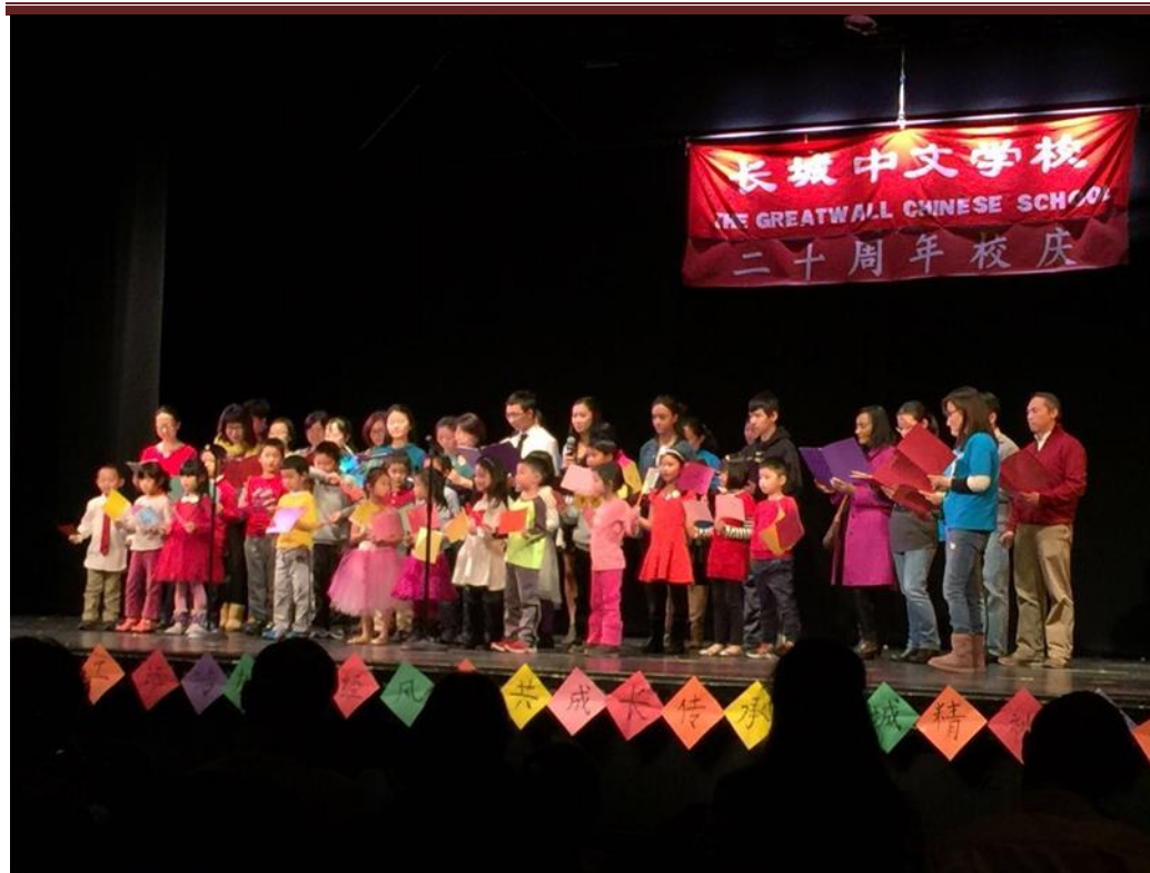
一年级小朋友和家长同台表演