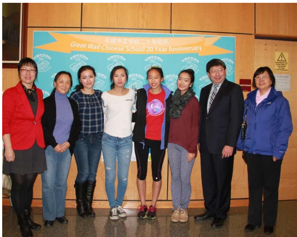
小木兰 2017 年毕业生合影