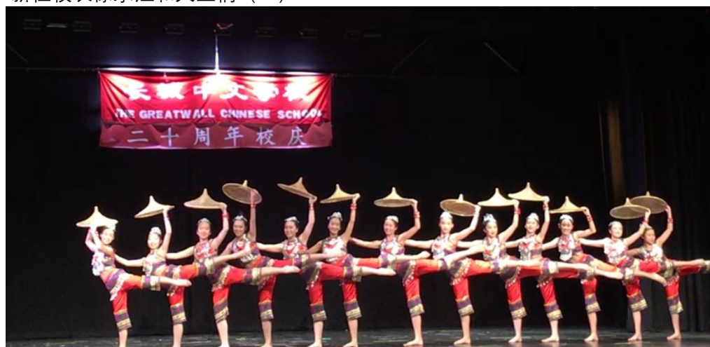
孩子们的精彩表演