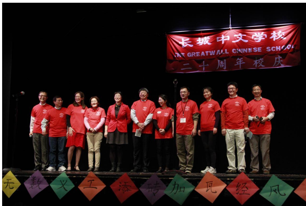
长城中文董事会成员